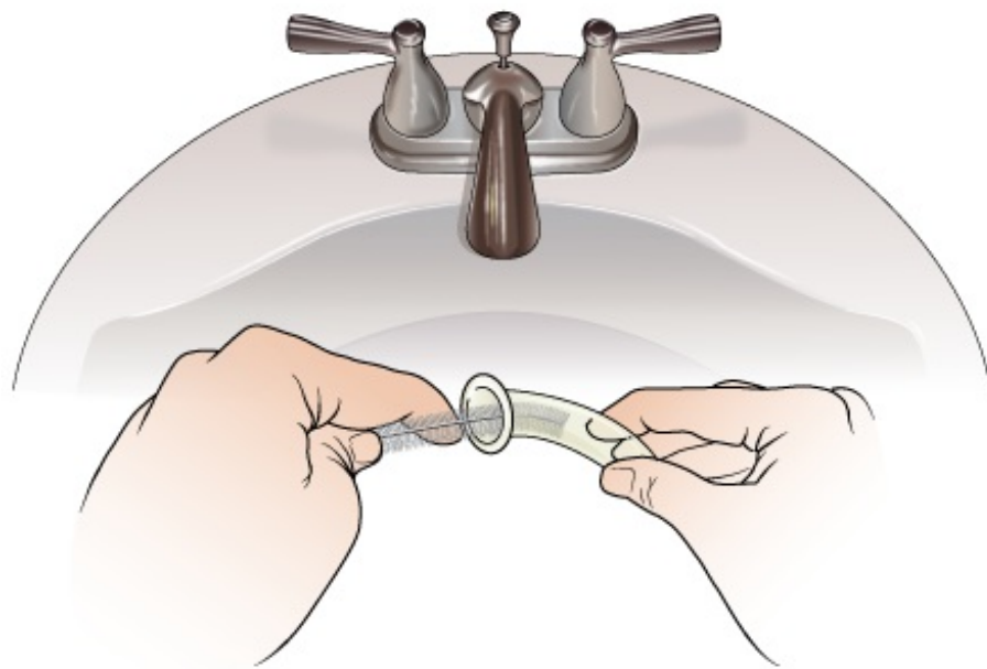
图 2. 清洁喉切除术管路