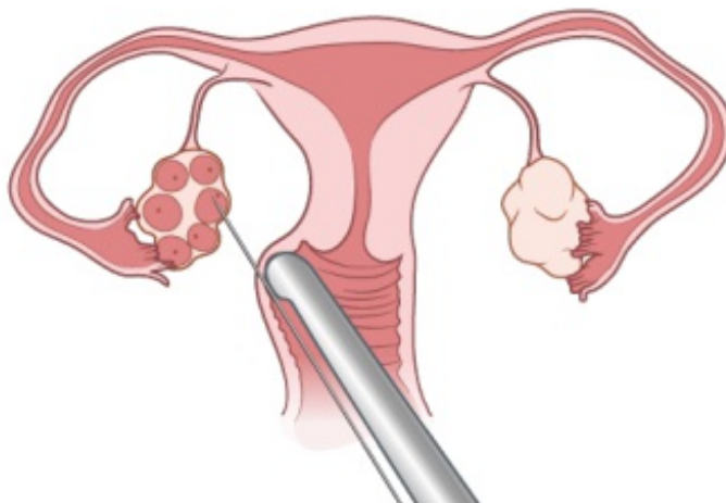
图 3. 取卵