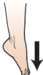
图 14. 脚趾 向下翘