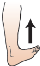
图 13. 脚趾 向上翘