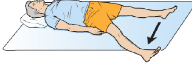
图 5. 外展肌强化练习