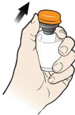
图 2. 取下塑料盖帽