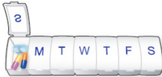
图 2. 药盒示例