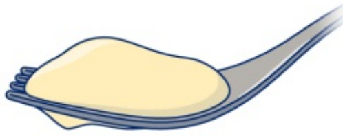
图 1. 叉子滴落测试