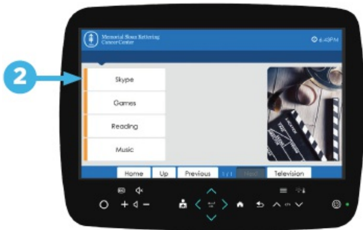
图 2. 选择 “Skype”