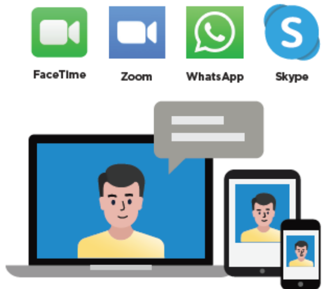
图 4. 在电脑或智能设备上视频呼叫

请最好在患者预约到访前做好这些准备工作。这样，当他们在预约到访时致电给您的时候，您就可以马上接听他们的来电（参见图 4）。