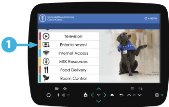
图 1. 选择“娱乐”

您的病房可能会配备一个带有 Skype 应用程序的交互式触摸屏设备。如果是的话，您可以使用该设备给您的家人或朋友拨打视频电话。您可以通过选择“娱乐”选项，然后选择“Skype”来访问 Skype 应用（参见图 1 和图 2）。