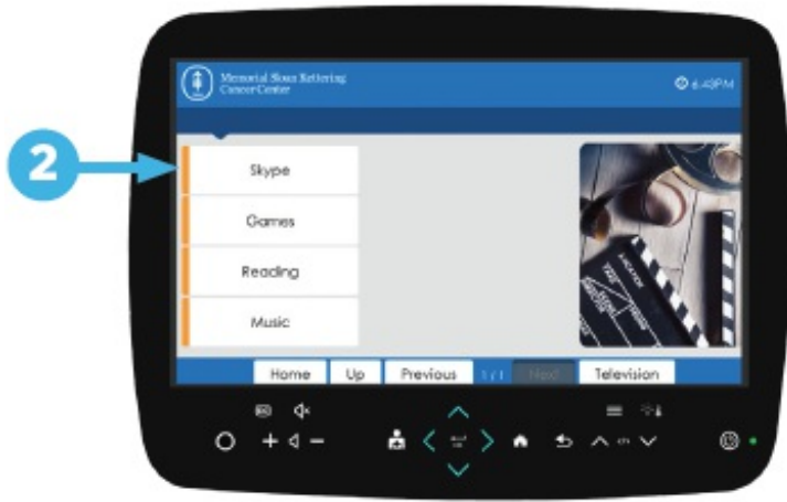
图 2. 选择 “Skype”