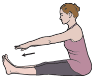
图 8. 腿部伸展