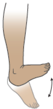
图 2. 脚踝踩动