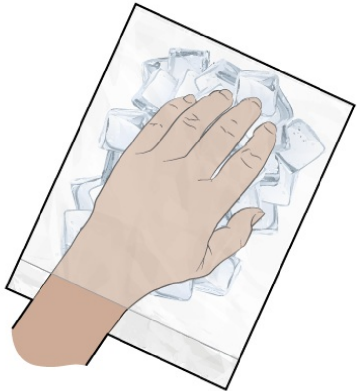
图 2. 指甲冷却期间

大多数人都能够接受指甲冷却，而不会出现任何问题。有些人会感觉冰不舒服，温度过低。也可能会妨碍您在治疗期间使用双手和四处走动。有些人会因为这些副作用而停止进行冷却。