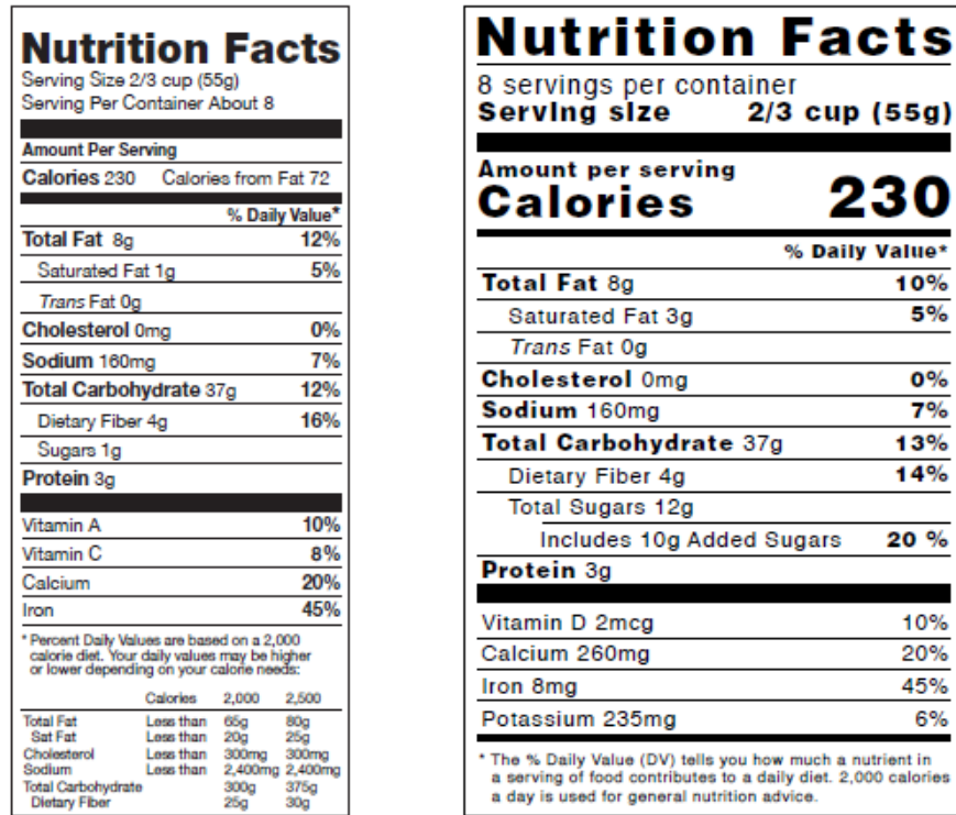
图 4. 食品标签