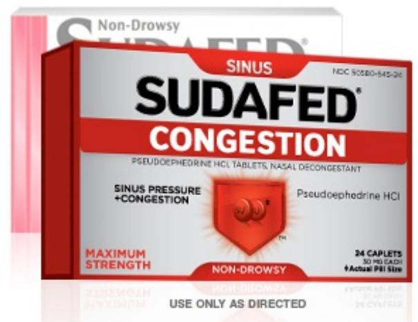
图 4. 盐酸伪麻黄碱