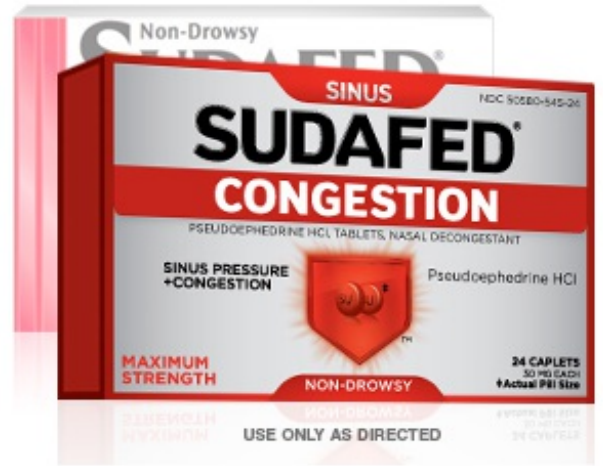
图 4. 盐酸伪麻黄碱