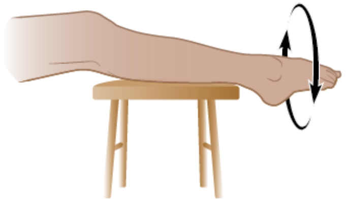
图 5. 脚踝转圈

If you have questions or concerns, contact your healthcare provider. A member of your care team will answer Monday through Friday from 9 a.m. to 5 p.m. Outside those hours, you can leave a message or talk with another MSK provider. There is always a doctor or nurse on call. If you're not sure how to reach your healthcare provider, call 212-639-2000.