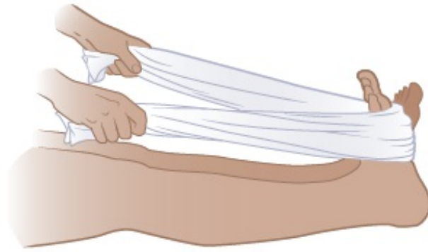
图 4. 脚部拉伸