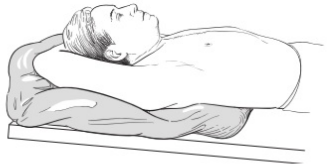
图 1. 在模具中的摆位

在整个模拟治疗过程中，您可能需要一直仰卧。当您躺在治疗床上的时候，将会根据您的上半身制作一个模具。您的放射治疗师会将温热液体倒入一个大塑料袋中，塑料袋将被密封并放置在治疗床上。您将躺在塑料袋上面，仰卧，双臂抬高至头部上方（见图 1）。液体最初会有温度，但它会随着变硬而冷却。液体冷却时，您的治疗师将会把该塑料袋贴在您的皮肤上，使其形成您的上半身和手臂的形状。这一过程大约需要耗时 15 分钟。