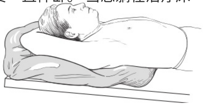
图 1. 在模具中的摆位

在整个模拟治疗过程中，您可能需要一直仰卧。当您躺在治疗床上的时候，将会根据您的上半身制作一个模具。您的放射治疗师会将温热液体倒入一个大塑料袋中，塑料袋将被密封并放置在治疗床上。您将躺在塑料袋上面，仰卧，双臂抬高至头部上方（见图 1）。液体最初会有温度，但它会随着变硬而冷却。液体冷却