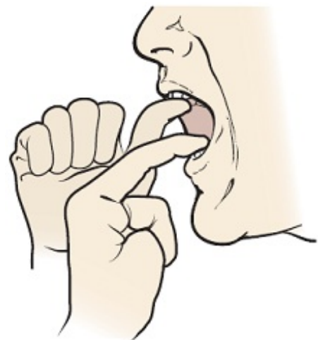
图 5. 用手指施加额外的阻力

吞咽专家可能会注意到您的吞咽能力是否发生了变化。如有变化，他们可能会教您其他练习或方法，帮助您在治疗期间保持吞咽能力。