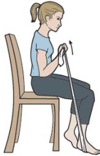
图 3. 将带子向上拉