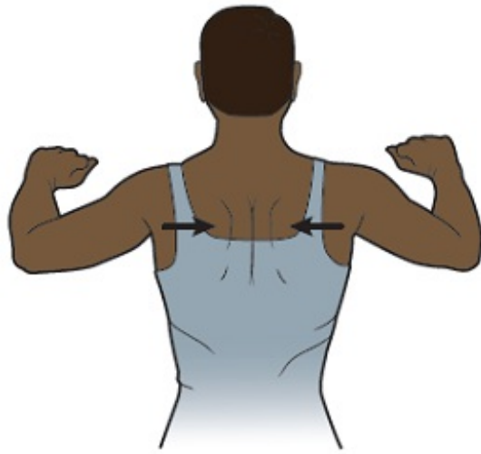
图 8. 挤压肩部