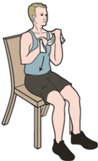
图 4. 握住弹力带，保持与下巴齐平