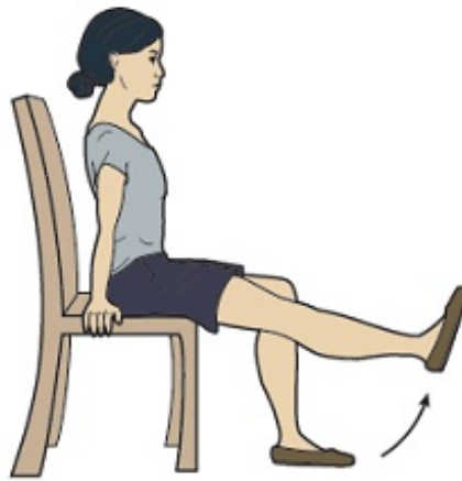
图 9. 坐踢

If you have questions or concerns, contact your healthcare provider. A member of your care team will answer Monday through Friday from 9 a.m. to 5 p.m. Outside those hours, you can leave a message or talk with another MSK provider. There is always a doctor or nurse on call. If you're not sure how to reach your healthcare provider, call 212-639-2000.