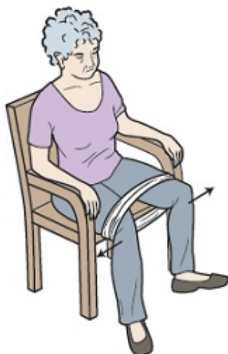
图 7. 使用弹力带进行坐姿外展肌强化练习