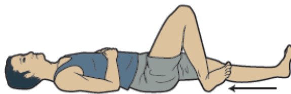
图 6. 脚后跟滑动