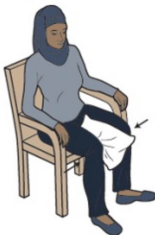
图 8. 坐姿枕头挤压练习