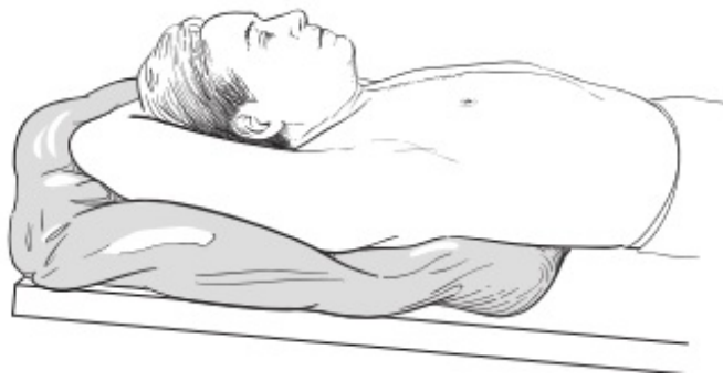
图 1. 身体模具

液体最初会有温度，但它会随着变硬而冷却。液体冷却时，放射治疗师会将该塑料袋贴在您的皮肤上，使其形成上半身和手臂的形状。这个过程大约需要 15 分钟。