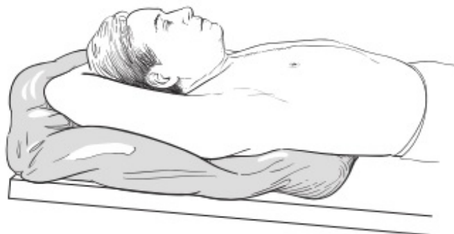
图 1. 身体模具

为制作模具，放射治疗师会将温热的液体倒入大号塑料袋中。他们会将塑料袋密封，然后放在治疗台上。您将仰卧在塑料袋上。大多数患者将采用双臂抬高至头部上方的体位（见图 1）。如果您将采用双臂下垂体位，则您的团队会与您讨论这一情况。