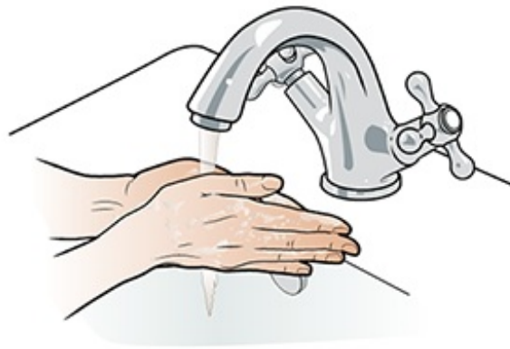
图 1. 用肥皂和水清洗双手。