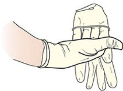
图 5. 举起另一只手套