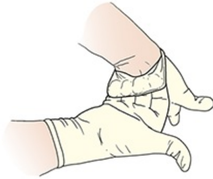
图 7. 将套口拉过手腕