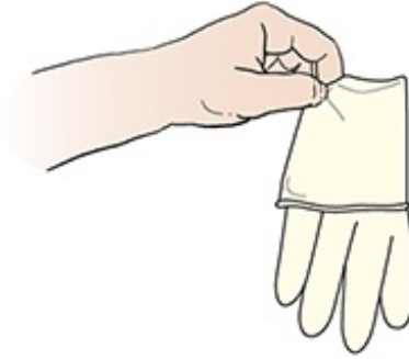
图 3. 提起第一只手套