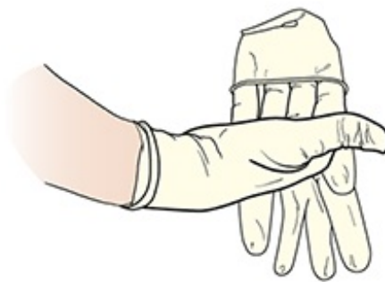
图 5. 举起另一只手套