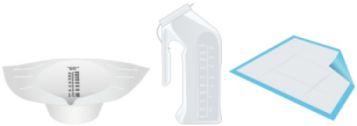
图 1. 尿液采集杯（左）、小便器（中）和防水垫（右）