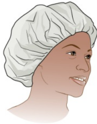
图 5. 一次性发帽