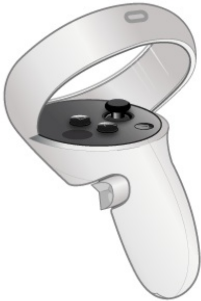
图 3. VR 控制器按钮