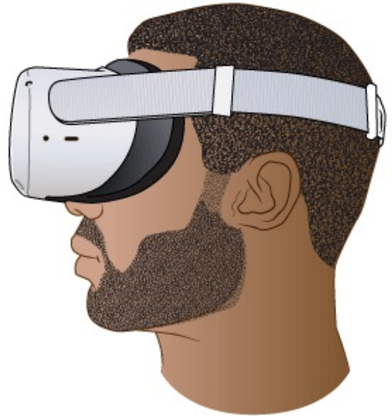
图 1. 佩戴 VR 头显

控制器上的按钮可以让您在 VR 中触摸、拿起和移动物品（见图 3）。控制器上还有传感器。当您握住控制器并移动双手时，也会在 VR 中看到自己的双手在移动。