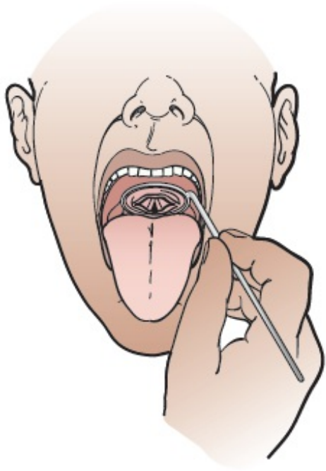
图 2. 观察声带