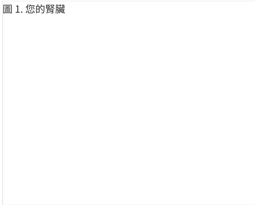
圖 1. 您的腎臟