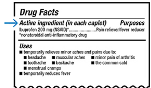
圖 1. 非處方藥標籤上的活性成分

根據您光顧的不同藥房，標籤通常看起來有所不同。以下是在 MSK 藥房標籤上尋找藥物活性成分（通用名稱）的例子（見圖 2）。