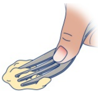
圖 3. 叉子壓力測試

將叉子放在食物上方。用拇指按下叉子（見圖 3）。如果食物被完全壓扁且不會恢復到原來形狀，那麼您的食物就夠軟了。