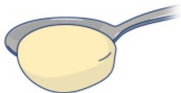
圖 2. 湯匙傾斜測試

食物應該很容易滑落，湯匙上幾乎沒有食物殘渣（見圖 2）。即使需要輕輕彈動湯匙以使食物掉落也沒關係。如食物黏在湯匙上或沒有從傾斜的湯匙上落下來，則代表食物太過濃稠。