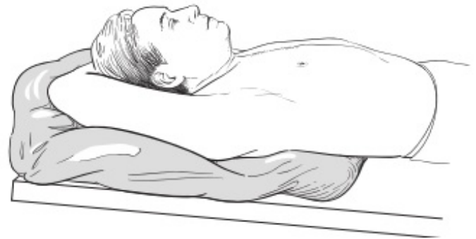
圖 1. 在模具中定位

在整個模擬治療過程期間，您可能需要背部朝下仰臥。您躺在治療床上時，會根據您的上身製作模具。放射治療師會把溫熱的液體倒進大型塑膠袋中，然後把膠袋鎖緊並放到治療床上。您需要背部朝下躺在塑膠袋上方，雙手舉起至高過頭部（請見圖 1）。一開始液體是溫暖的，但會隨著硬化而冷卻。液體冷卻期間，您的治療師會把塑膠袋緊貼到您身上，好讓模具能複製出您上身和手臂的形狀。此程序大約需要 15 分鐘。