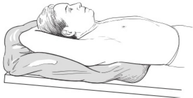
圖 1. 在模具中定位

治療師會把塑膠袋緊貼到您身上，好讓模具能複製出您上身和手臂的形狀。此程序大約需要 15 分鐘。